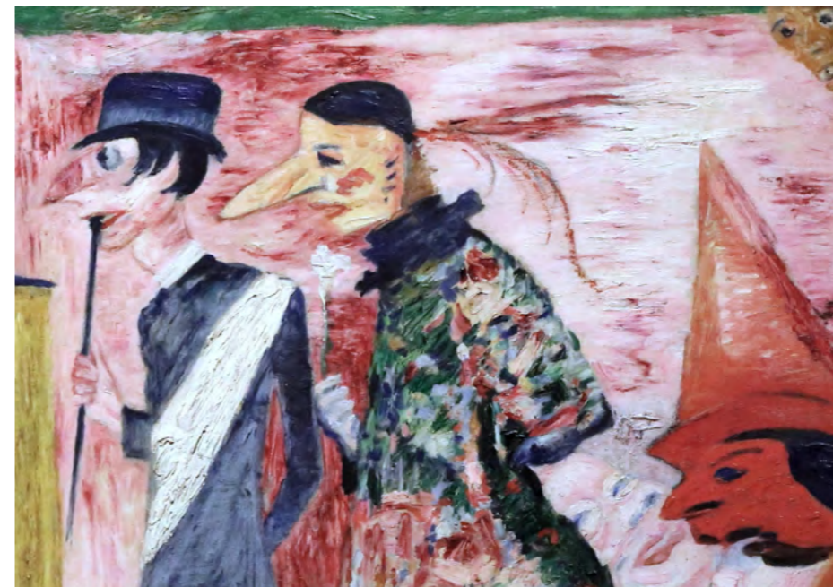
Personnages devant l'affiche de « la gamme d'amour » (détail), James Ensor (1860-1949), Bruxelles Musées Royaux des Beaux Arts de Belgique.