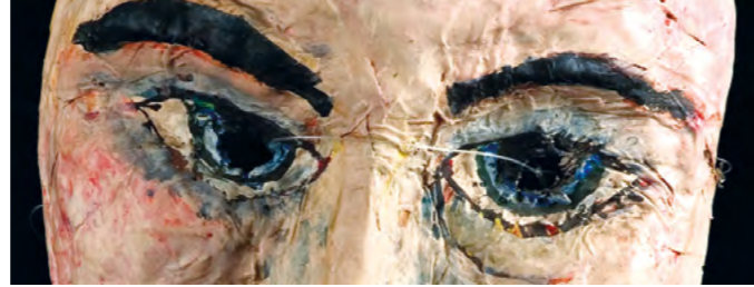
Masque pour Don Louis (détail), Michel de Ghelderode

Et puisque dans la vraie vie Don Juan n'est pas mort, dans notre version (inspirée par La Dernière Nuit de Don Juan , d'Edmond Rostand), Don Juan ne meurt pas à la fin. Il pactise avec le Diable , et revient d'outre-tombe :